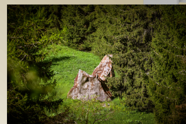
A - 10,5 cm