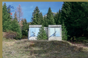
Ouvrages d'instruction - 10,5 cm