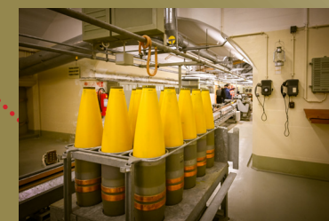
C - 15 cm