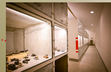
C - 15 cm