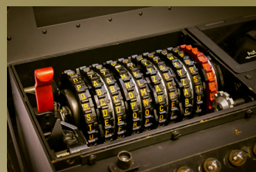
F - Espace du chiffre