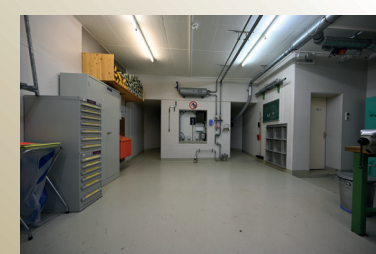
E - 12 cm