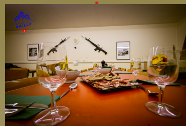
D - Bistrot col Roesti