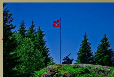
Accueil - chalet Planaux et parking